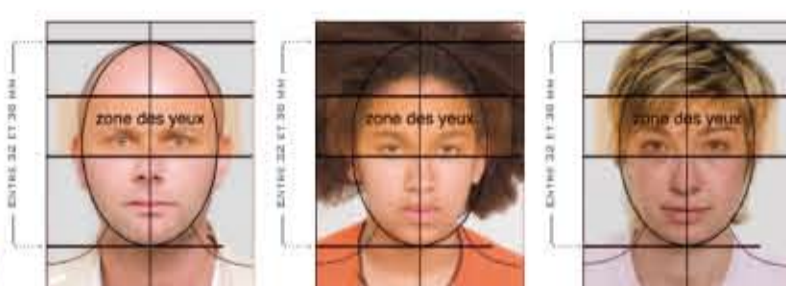
CONFORME À LA NORME ISO/IEC 19794-5 : 2005